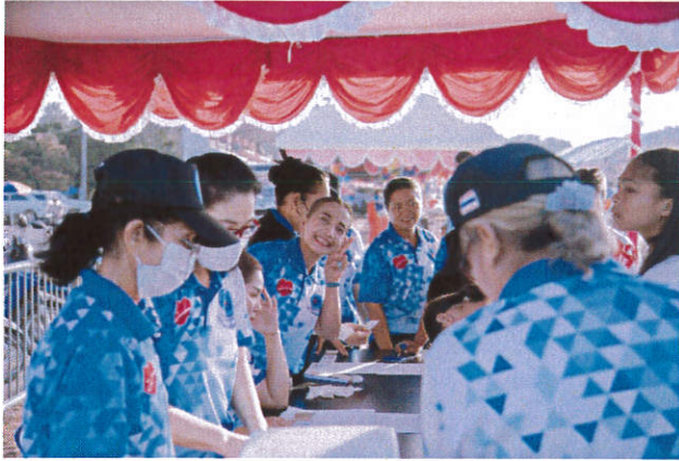
จุดรับลงทะเบียนผู้เข้าร่วมงานวันเด็กแห่งชาติ